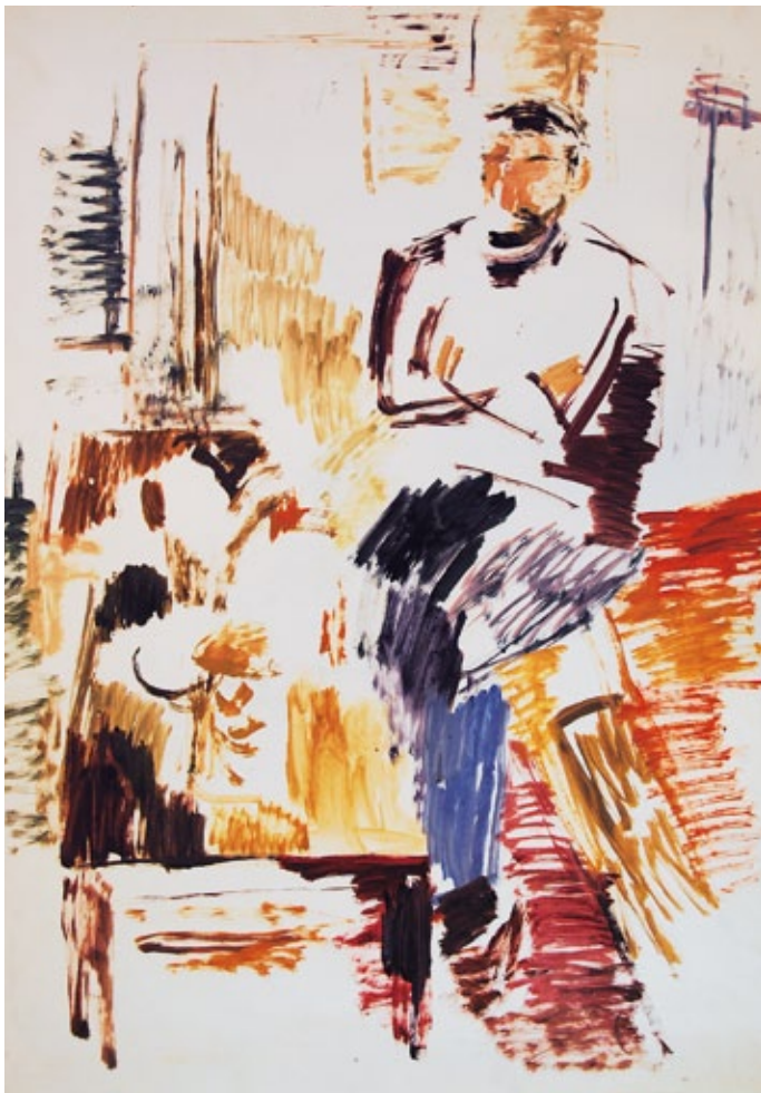
links: Figur im Raum, 1988, Pinsel/Öl auf Papier, 59 x 42 cm